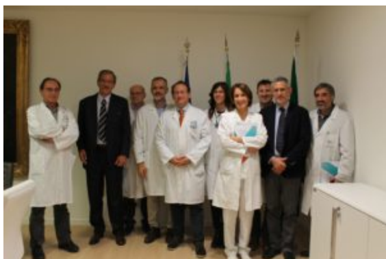
L'équipe dell'Ospedale Papa