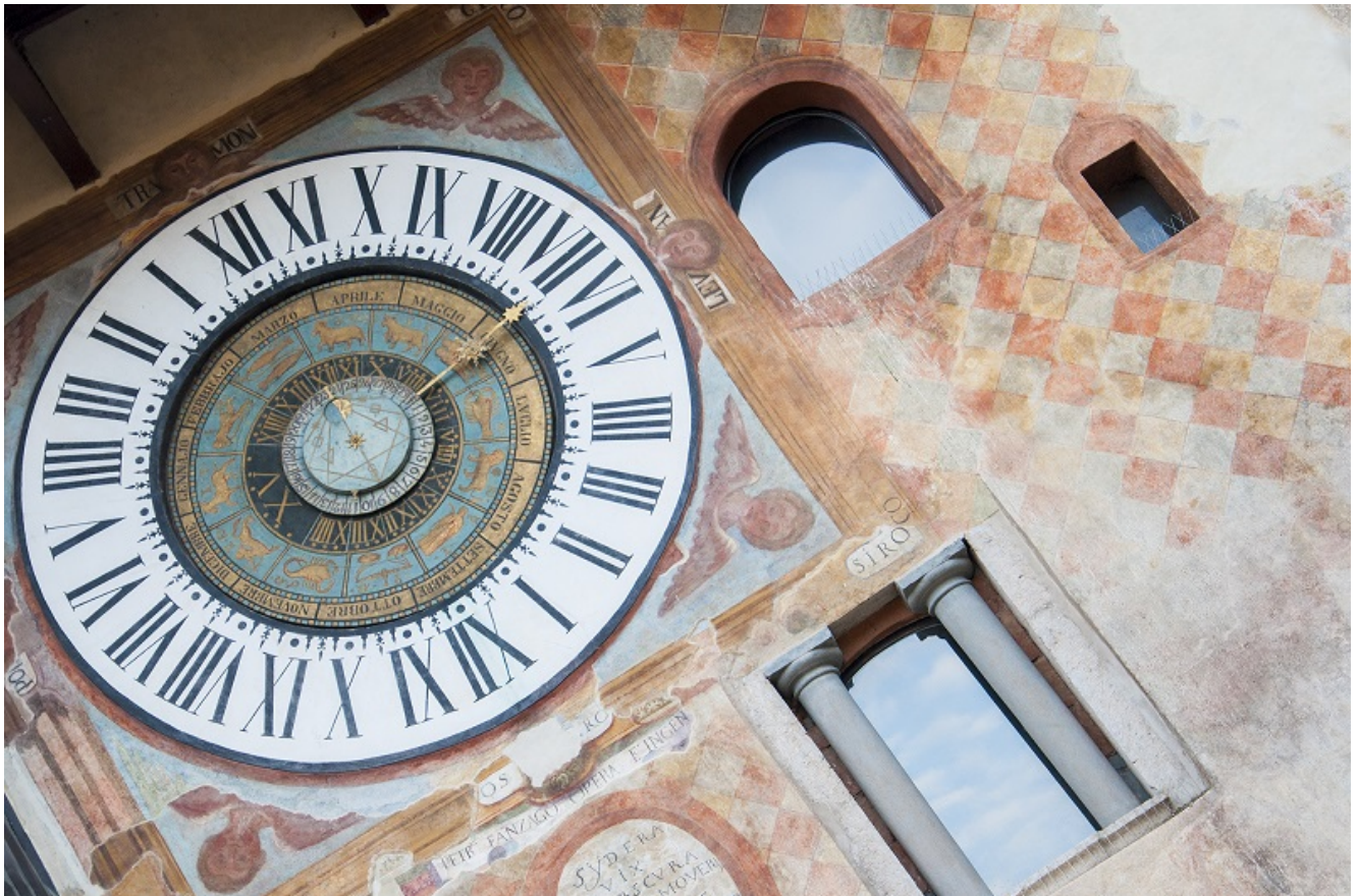
L'Oratorio dei Disciplini, edificio medioevale del XIV secolo con i suoi affreschi unici: il ciclo dedicato alla Morte è il più completo