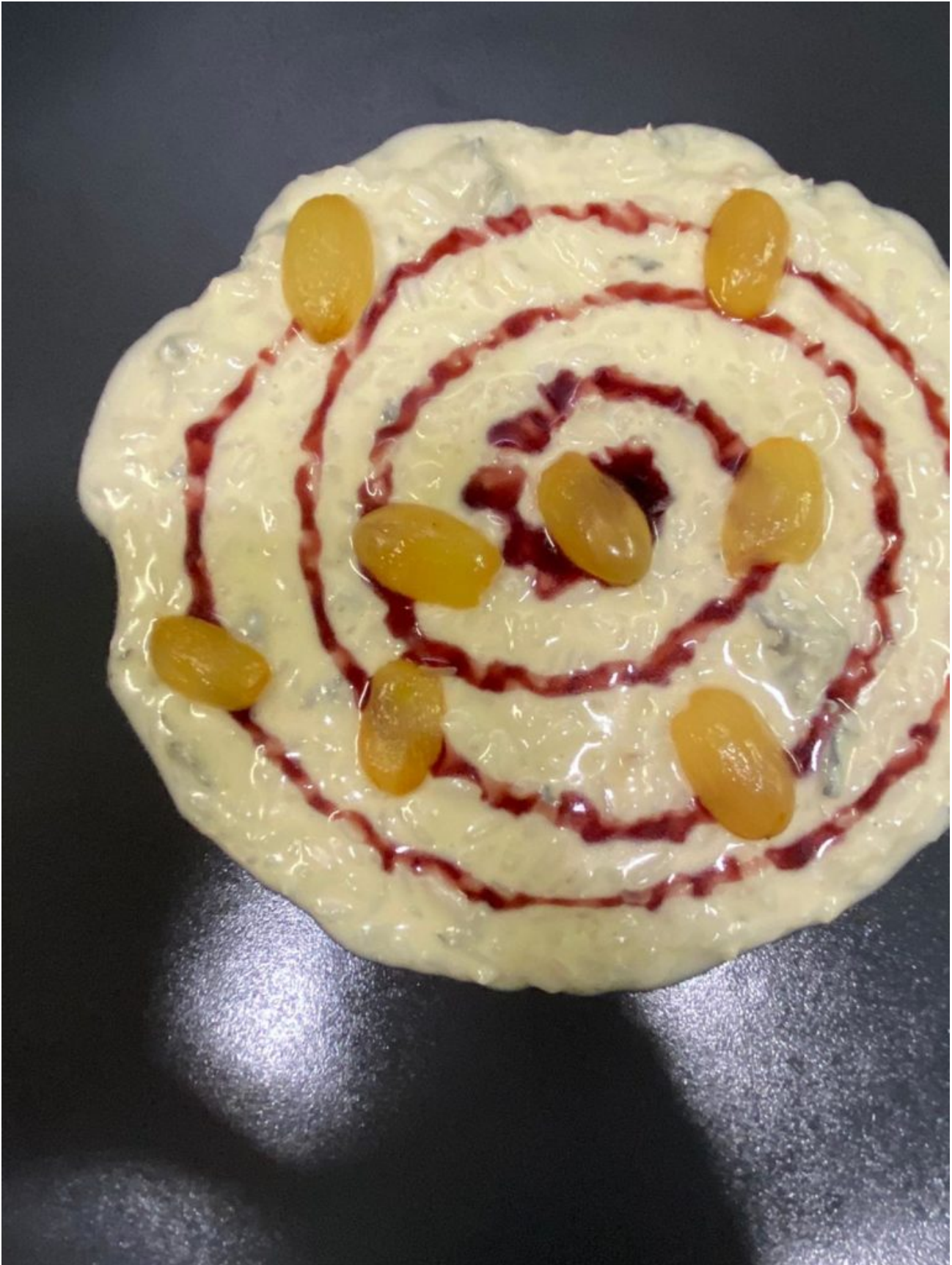
Risotto mantecato al Blu Rossini di Arrigoni Battista con Raisin e riduzione al Valcalepio rosso Riserva