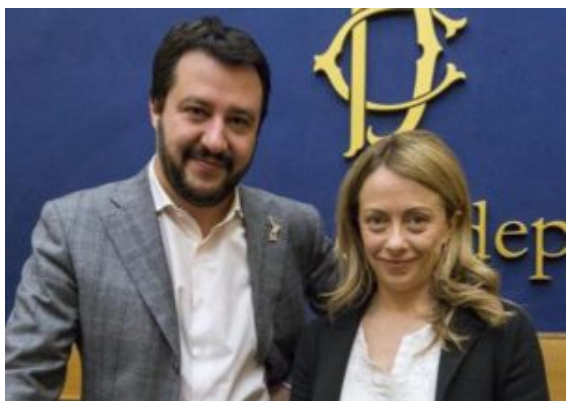
Matteo Salvini e Giorgia Meloni

ridotto, il centrodestra non ha la benché minima chance di arrivare sulle macerie lasciate da Ignazio Marino e dai suoi illustri predecessori (a partire da Terminator Alemanno). E in secondo luogo, perché a Matteo Salvini anzitutto, e a Giorgia Meloni di conserva, sta a cuore ben altra partita. Una sfida rivolta al futuro, a conquistare la leadership per cominciare a ricostruire il disastroso terreno dei moderati e conservatori.